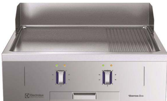
588539 (MBHOBBOAO) Stekhäll, el, med slät och räfflad kromhäll, betjänas från 1 sida med hög bakkant, helmodul